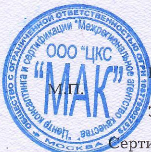
Схема сертификации 4

акта оценки оказания услуг от 03.11.2021г. № 4465/Д.